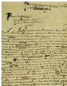
Préface des Diaboliques