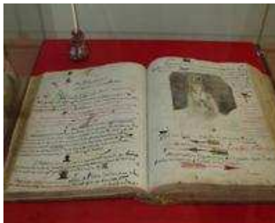
Autre page du Disjecta Membra