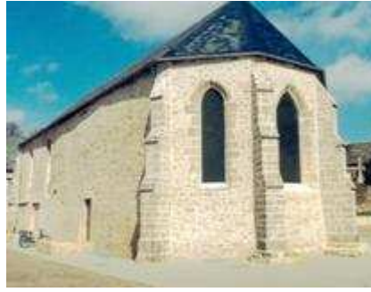
L'Hôtel-Dieu à Valognes