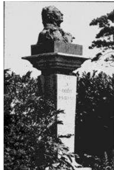
Buste de Barbey par Néno sur son socle d'origine conservé