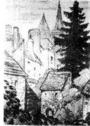
Autre dessin sélectionné par Monsieur Centorame