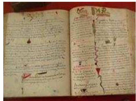
Pages du Disjecta Membra

Ces deux colloques feront l'objet d'une publication scientifique , le colloque universitaire intégrant les interventions des participants.