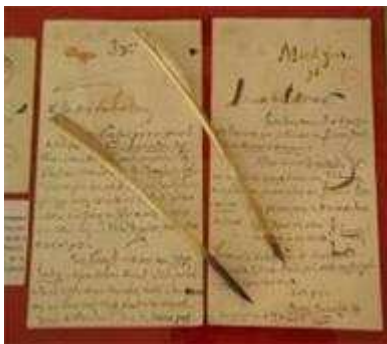
Lettre de Saint-Maur

Cet événement parisien sera suivi d'un second colloque organisé en Basse-Normandie par l'Université de Caen. Ce colloque intitulé " Barbey d'Aureville, un écrivain à travers les genres " se tiendra les 16, 17 et 18 octobre 2008 et rassemblera les spécialistes du "Connétable des Lettres". Les deux premières journées auront lieu à l'Université de Caen, puis les participants de ce colloque se rendront la dernière journée à Valognes et à Saint-Sauveur-le-Vicomte, pour découvrir les hauts lieux aurévilliens de la région. Le colloque sera animé par une trentaine d'intervenants dont la moitié d'enseignants chercheurs de l'université de Caen.