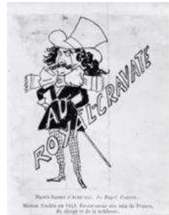
Caricature de la tenue vestimentaire de Barbey

Une troisième exposition aura lieu à l' Hôtel-Dieu à Valognes . Les illustrateurs de Barbey d'Aurevilly que Monsieur Bruno CENTORAME , historien, a sélectionnés parmi les nombreuses éditions des ouvrages de Barbey d'Aurevilly, seront présentés en couleur au grand public du 17 juin au 30 septembre 2008 à la Bibliothèque Municipale de Valognes . Cette exposition permettra également de découvrir des éditions originales rares.