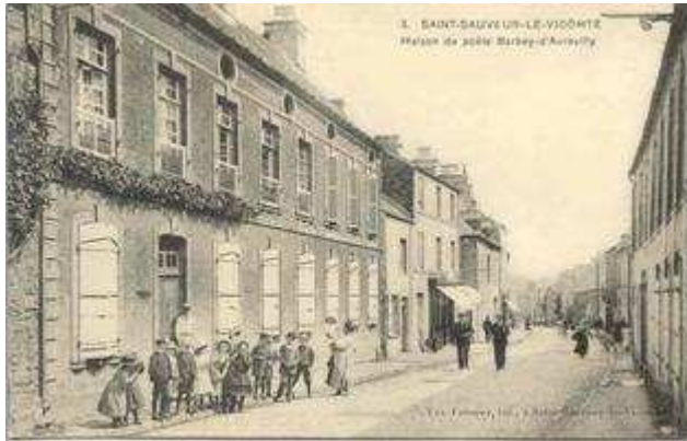
Maison familiale de Jules Barbey d'Aurevilly - Musée actuel

Trois expositions temporaires qui évoqueront chacune un thème de la vie et des œuvres de Barbey d'Aurevilly sont prévues à Saint-Sauveur-le-Vicomte, à Valognes et au Musée Christian Dior à Granville.