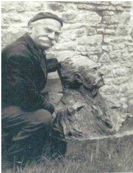
Buste de Barbey sculpté par Auguste Rodin