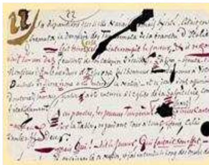
Brouillon de Barbey d'Aurevilly

Un catalogue accompagnera cette exposition de manuscrits et de livres rares.