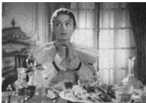
Anouk Aimée dans Le Rideau Cramoisi

A partir du mois de juin 2008, l'actrice Anouk Aimée qui a notamment figuré dans l'adaptation cinématographique du Rideau Cramoisi de Alexandre Astruc en 1952, consacrera dix soirées d'une heure environ, à la lecture d'extraits choisis tirés de l'œuvre littéraire de Jules Barbey d'Aurevilly. Le choix des textes et la préparation seront confiés à Monsieur Frédéric Vitoux de l'Académie Française.