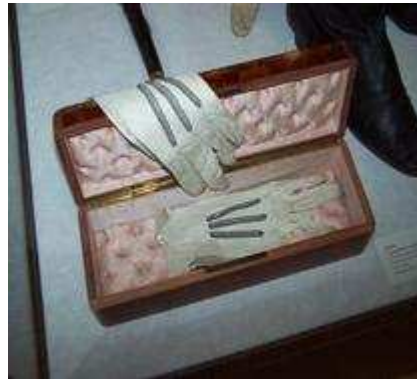
Gants ayant appartenu à Barbey d'Aurevilly