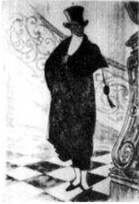
Une des iconographies sélectionnées par M. Centorame