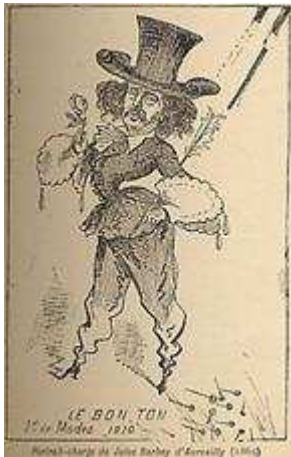
Caricature de Barbey d'Aurevilly dans la revue Le Bon Ton en 1863

été le premier ouvrage consacré au dandysme en France, cette exposition évoquera les grands écrivains liés au dandysme (Barbey, Baudelaire, Montesquiou, Proust, Sollers...) en privilégiant leurs rapport à l'élégance à la fois de façon symbolique avec leurs textes et leurs figures littéraires mais aussi dans leurs modes de vie.