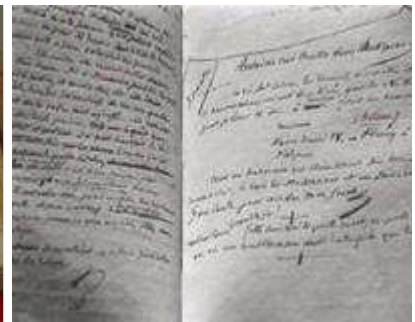
Page du manuscrit L'Amour impossible